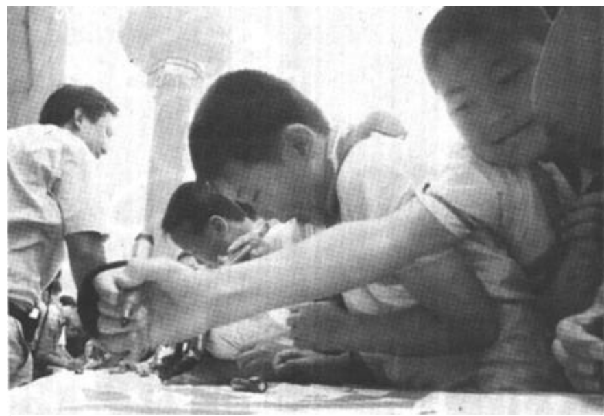
在“遵章出行 平安回家”的条幅上签下自己的名字,做一名遵章的好学生