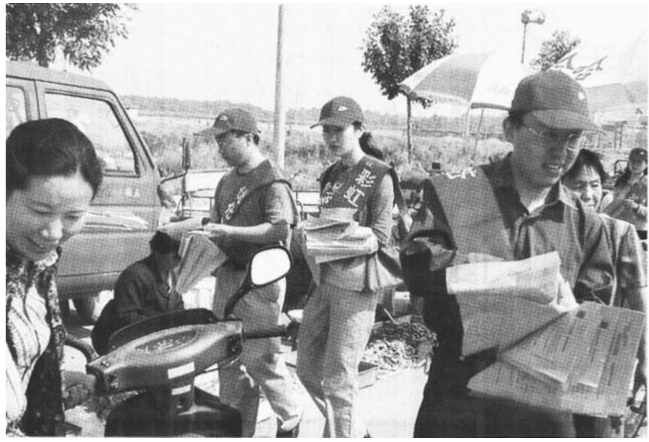
近日, 垦利县供电公司积极组织干部职工上街宣传“彩虹工程”、安全用电常识和电力设施保护工作的重要意义。